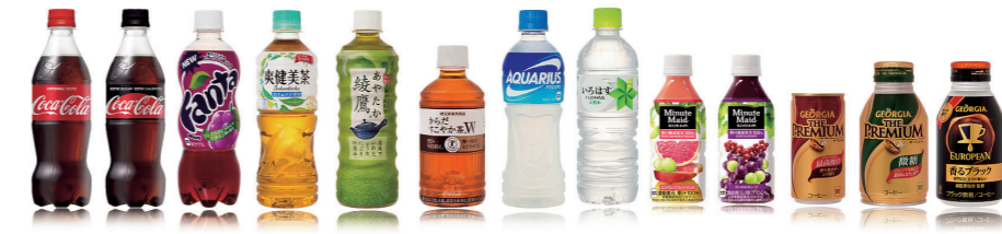
コカ・コーラ社製品詰合せ