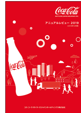
アニュアルレビュー