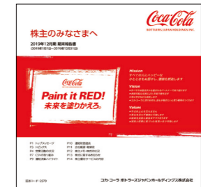
株主のみなさまへ