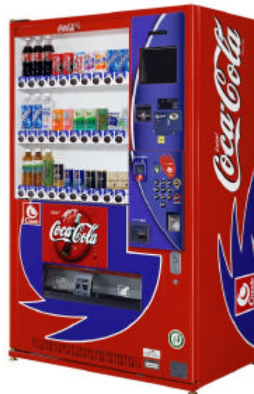
New Vending Machine with Built-in Information Terminal, "Cmode-machine"

コンピュータとディスプレイ、スピーカー、プリンタ等を搭載した、新情報端末型自動販売機「シーモ」。 ボタンを押すと「Cモード」に切り替わり、各種 Cmode サービスが利用可能。