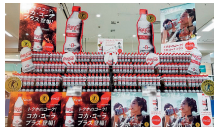
スーパーマーケットでの売場づくり

スーパーマーケットでは、コカ・コーラ プラスなどの特定保健用食品や機能的表示食品を積極的に展開するとともに、業態やお得意さまの状況に応じ、適切な製品(ブランド・容量・パッケージ)を最適な卸売価格で販売するなど、きめ細かい営業活動を行うことで、利益を伴う売上高の増加に取り組みました。一方、コンビニエンスストアでは、新製品の投入やお得意さまとの共同プロモーションの展開等により、売上げ増加を図りました。