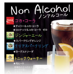
当社製品を使用した ドリンクメニュー

飲食店では、当社製品を使用したドリンクメニューを提案するなど、当社製品の取り扱い拡大を図りました。特に、ノンアルコールカクテルを「モクテル」として展開し、新たな需要の獲得に努めました。また、売店等では、レギュラーコーヒー機器や卓上クーラーなどの販売機器を活用することで、取引店舗の増加に努めました。さらに、インターネット通販に対するお客さまのニーズの高まりを受け、インターネット通販店への営業活動にも注力しました。