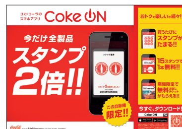
スマートフォンアプリ「Coke ON」

自動販売機1台当たりの売上げ増加を目指し、ロケーションに応じた最適な品揃えを徹底するとともに、高付加価値製品や自動販売機専用製品の展開を強化しました。また、スマートフォンアプリ「Coke ON」対応自動販売機の台数増加にも取り組みました。新規設置における優良ロケーションの獲得に向けては、ポテンシャルの高い屋内ロケーションへの積極展開を行うなど、収益性を見極めた活動に注力しました。