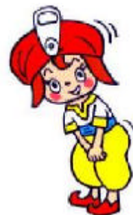
バーチャルガイド“エコー”